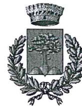
Vietri di Potenza