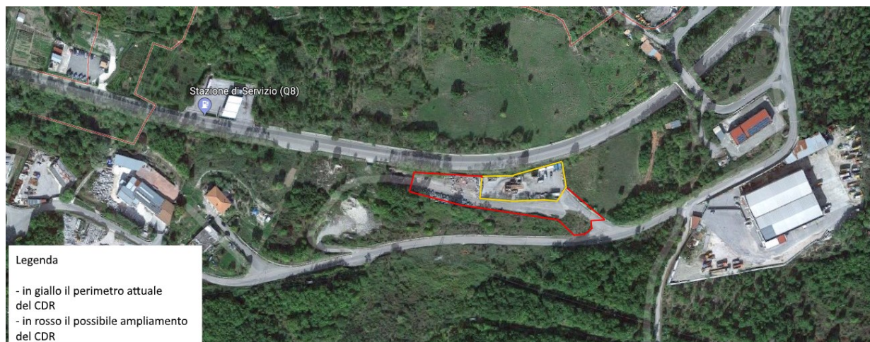
STRALCIO VISTA AEREA SATELLITARE AREA CENTRO DI RACCOLTA IN LOC. SANT'ANTONIO