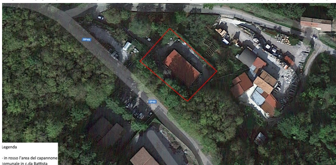
STRALCIO VISTA AEREA SATELLITARE AREA CAPANNONE COMUNALE IN C.DA BATTISTA

Le informazioni grafiche fornite col presente elaborato devono ad ogni modo essere verificate dall'operatore economico concorrente che effettua la sua proposta progettuale sulla scorta di proprie autonome valutazioni senza potersi rivalere in alcun modo nei confronti della Stazione Appaltante.