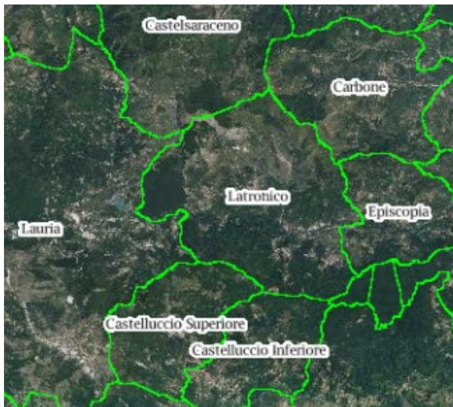
STRALCIO VISTA AEREA SATELLITARE COMUNE DI LATRONICO CON COMUNI CONFINANTI