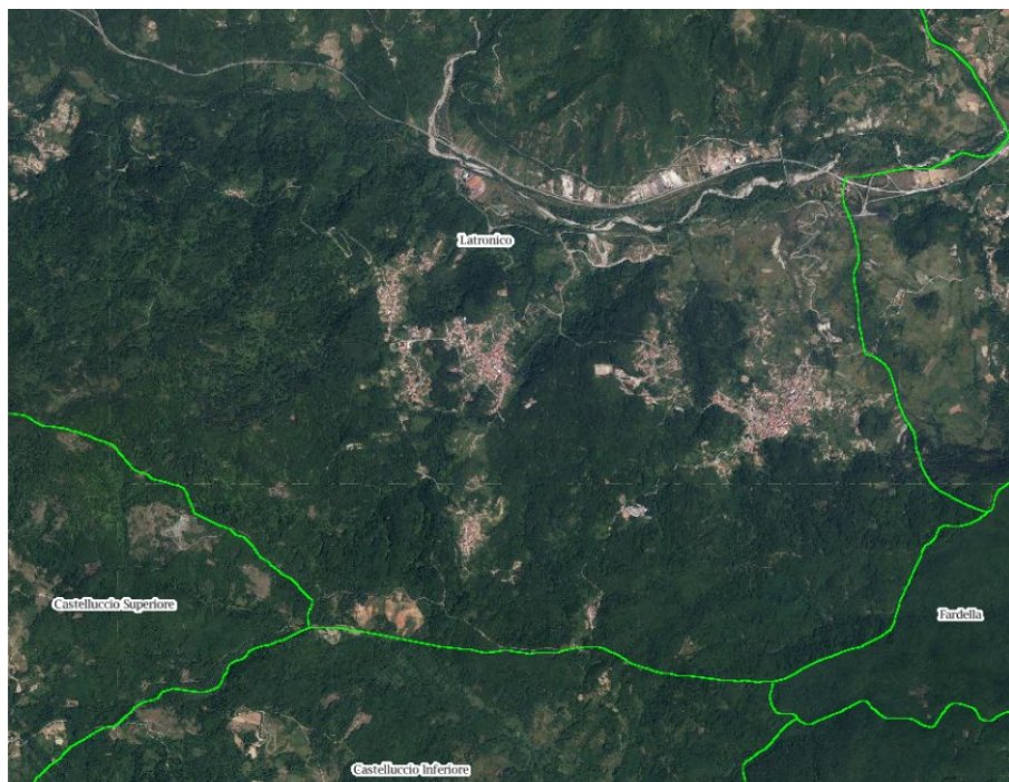
STRALCIO VISTA AEREA SATELLITARE COMUNE DI LATRONICO AGROMONTE MAGNANO E AGROMONTE MILEO E ALTRE FRAZIONI