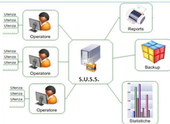
Grafico illustrativo SUSS