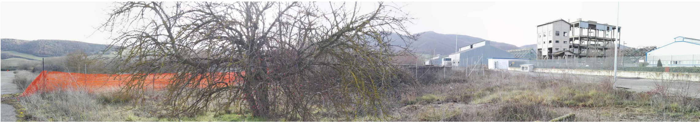
FOTO PANORAMICA 2