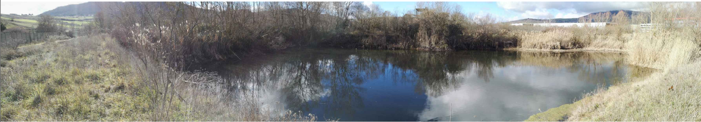
FOTO PANORAMICA 1